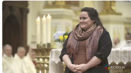
Fête patronale de l'Immaculée Conception 2025

Que notre communion soutienne les familles plongées dans l'épreuve.